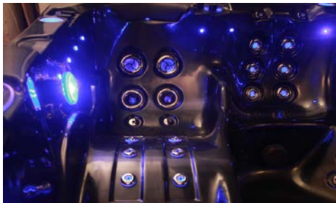
Belysta jets och vattenlinje