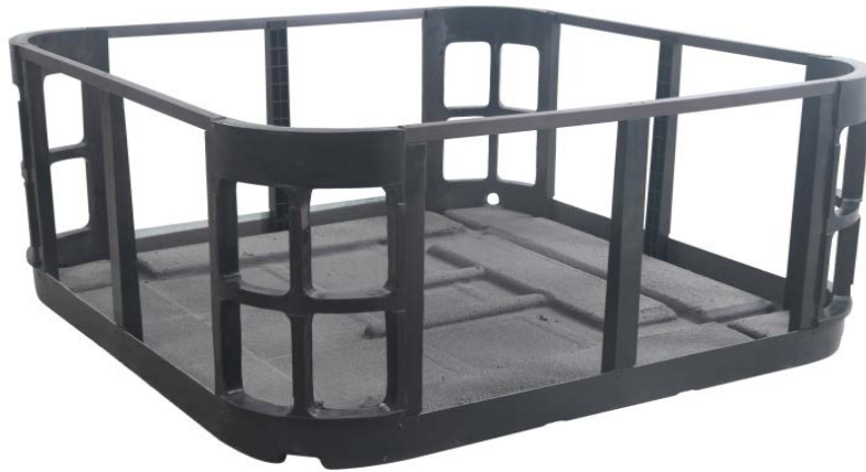
Urustad med kompositram