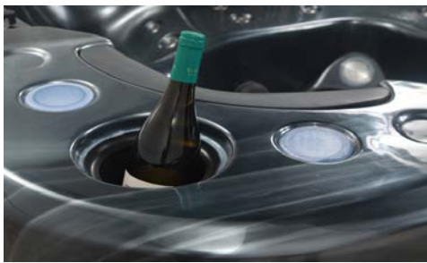
Plats för flaska